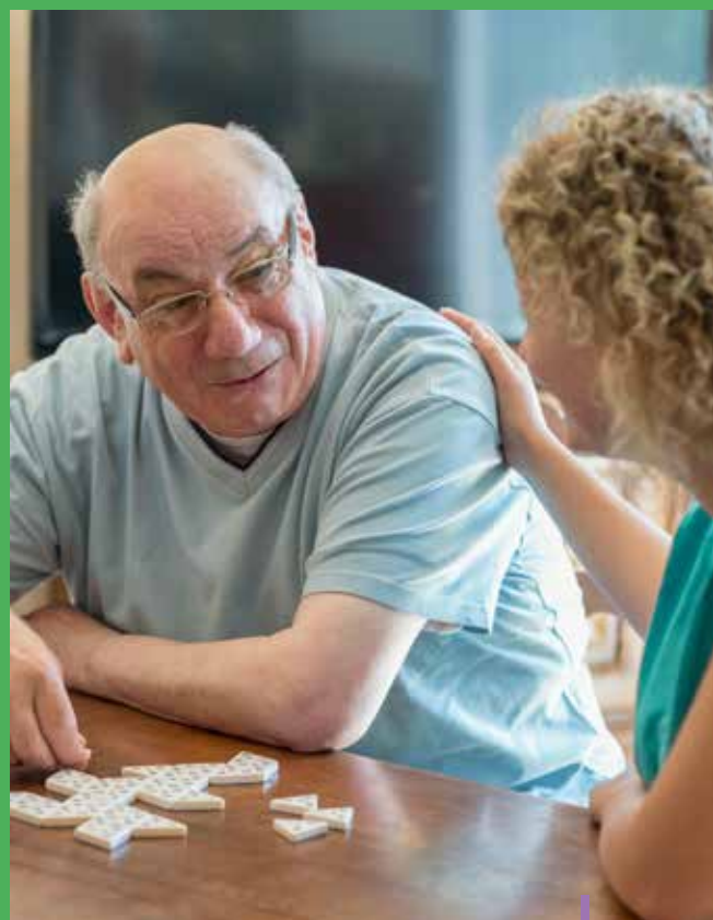
ADMR 44 EN ACTION Photo reportage

Créatrice de lien social, porteuse de valeurs structurantes pour notre réseau et pour tous les territoires, l'ADMR propose un véritable projet de société.