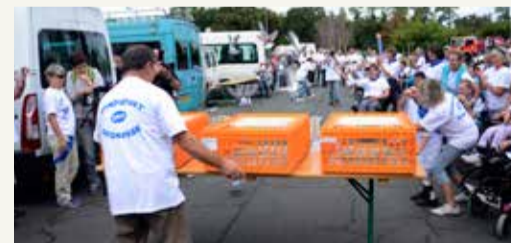
Ⓜ Traditionnel lâché de pigeons de la journée handisport.

de partager des moments émouvants et profondément humains de loisirs et de joie avec plus d'une centaine de Landais de tous âges touchés par le handicap. Des ateliers et activités variés : judo, pétanque, tennis, golf, tricycles, promenades, défilés de voitures anciennes et de motos ont rythmé la journée pour le plus grand bonheur des participants. Le ciel menaçant depuis l'aube vit l'apparition d'un soleil bienfaisant au moment du traditionnel lâcher de pigeons, comme un clin d'œil complice à toutes les bonnes volontés qui permirent encore cette année à cet événement du partage de s'inscrire dans les traditions de notre ville. ■